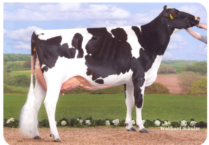
Rica (v. Adlon P)