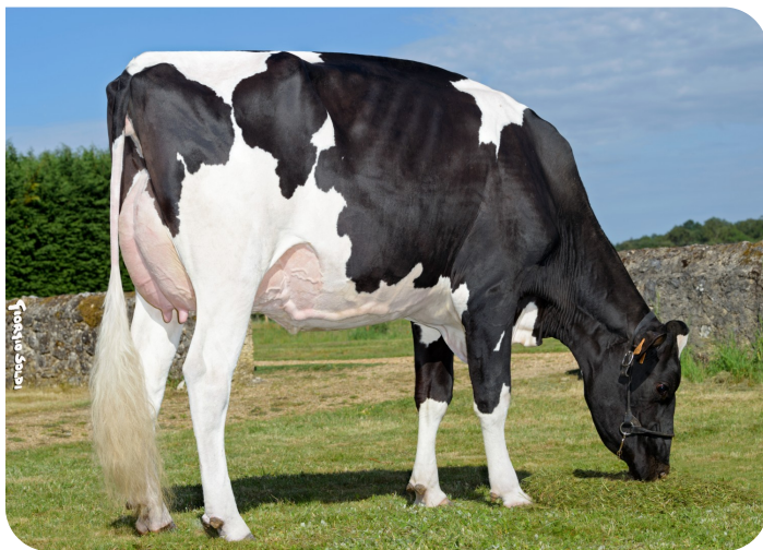
Suzy (v. Adlon P)