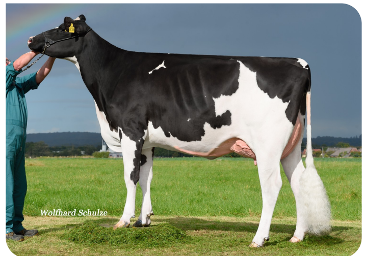
Adia (v. Adlon P)