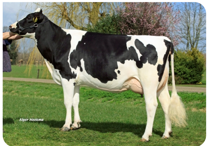
Galaxy Binale 31 (v. Ludo) Eig.: Mts. te Winkel-Woestenenk, Ruurlo