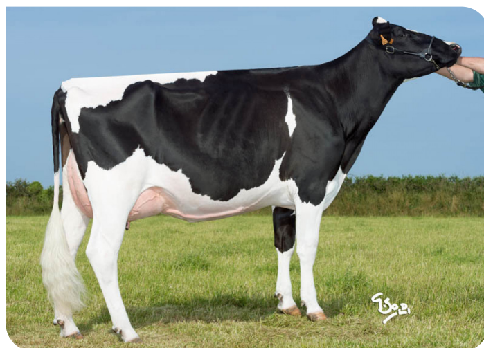
Gazelle 55 (betovergrootmoeder van Alexis rf (PP))