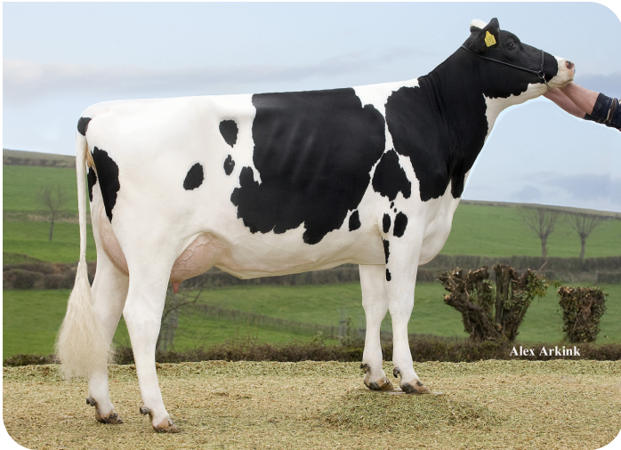
Apina Massia 172 (AB 87) (grootmoeder van Movistar)