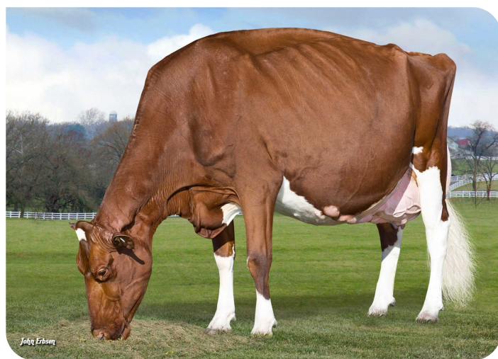
KHW-Regiment Apple-Red (EX 96) (moeder van Challenger-Red)