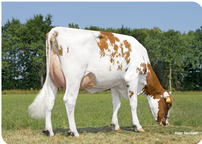
Grashoek Silke 212 (v. Archimedes rf) Eig.: Melkveebedrijf Grashoek b.v., Grashoek