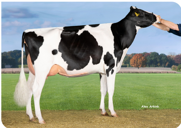
Veneriete Mitchell Leona 4 (v. Mitchell) Eig.: Veneriete Holsteins, Kampen