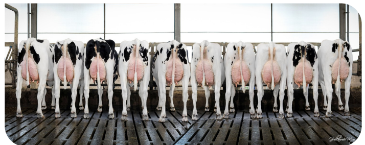
Dochtergroep Mitchell, Molenkamp Holsteins, Maasbommel