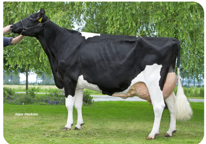
Beeze Roza 48 (A 90) (moeder van Maikman)