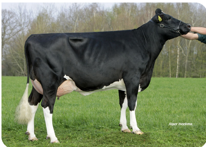
Brechtje 1 (v. Blackjack)