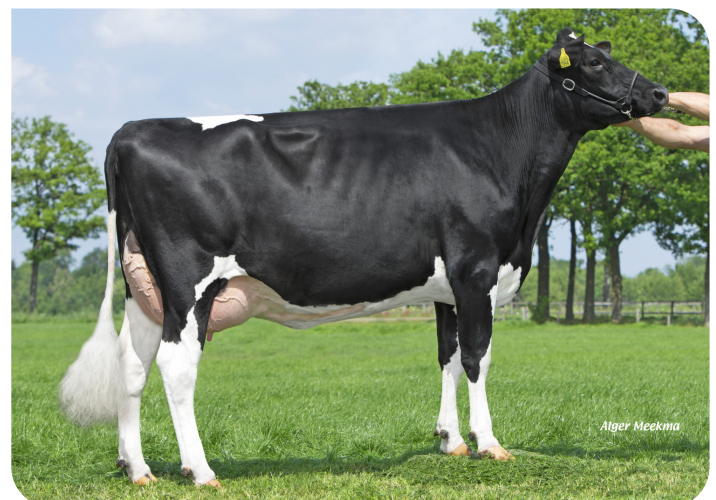
Ynskje 168 (v. Clyde)

Fig.: Klein Wassink J.B. en Alefs I.M.H., Ruurlo