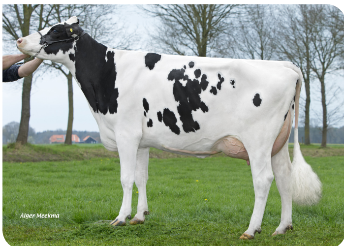
Sonja 99 (v. Clyde)

Fig.: Klein Wassink J.B. en Alefs I.M.H., Ruurlo