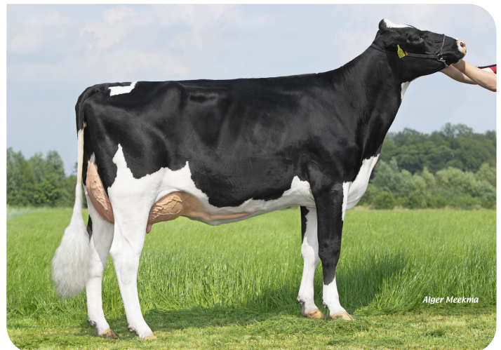
Herma 30 (v. Evergreen) Eig.: Melkveebedrijf Bots, Rekken