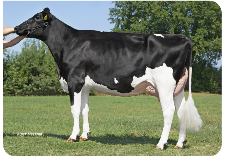
Talke 93 (v. Redstar) Eig.: Mts. A.J.M.Lenferink, Almelo