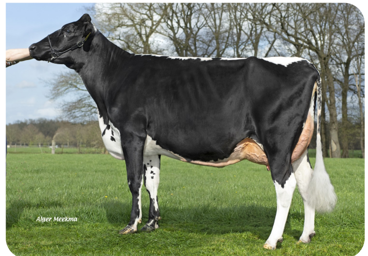
Angels Holdi 563 (v. Redstar) Eig.: Angels Holsteins, Meijel