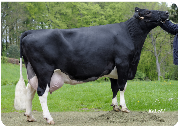
Valor Kiralle 853 (A 90) (grootmoeder van Bisor)