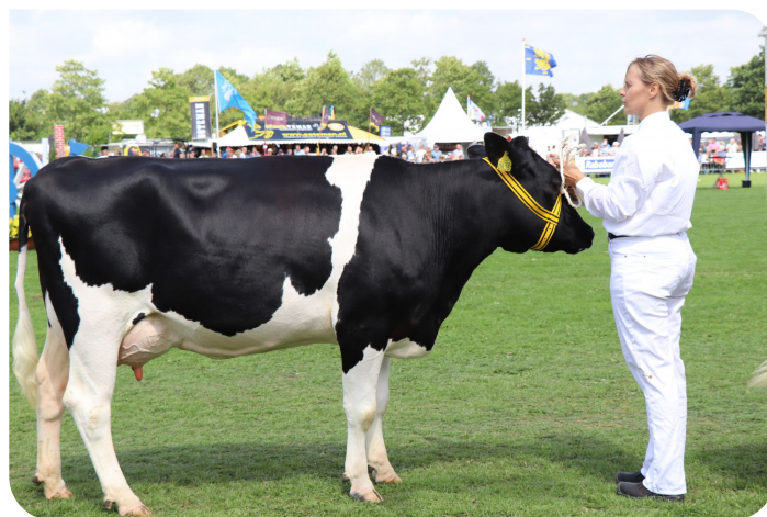
Jet 183 (v. Bas 8)