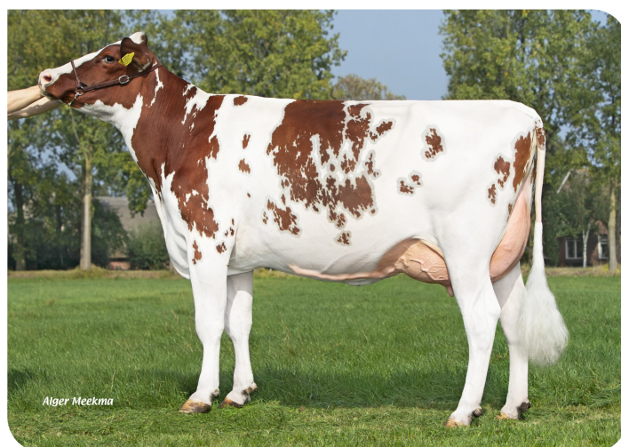
Lisa 14 (v. Blogger) Fig.: Mts. R. en C. Kooyman-de Jong, Leerdam