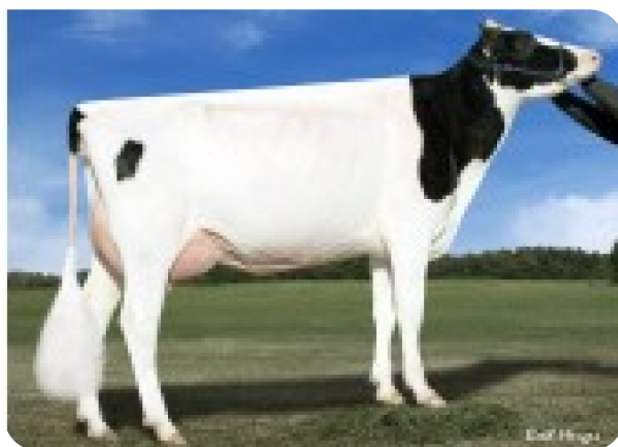
Planet Silk (A 90) (overgrootmoeder van Vladimir rf (Pp))