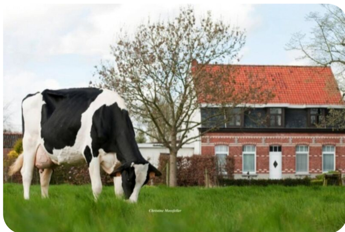
Arums Beautiful (AB 84) (overgrootmoeder van Mambo)