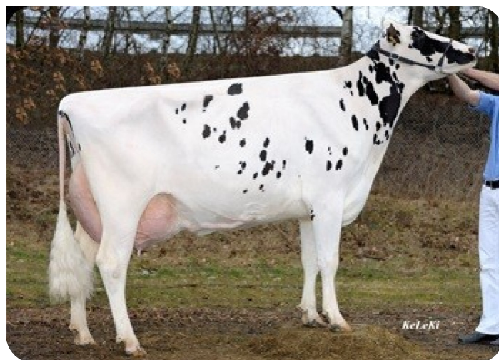
RZB Orleander 1022 (A 91) (grootmoeder van Orlando)