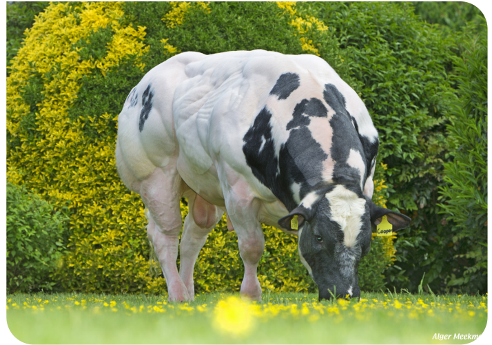
Cooper van de Blomsteeg