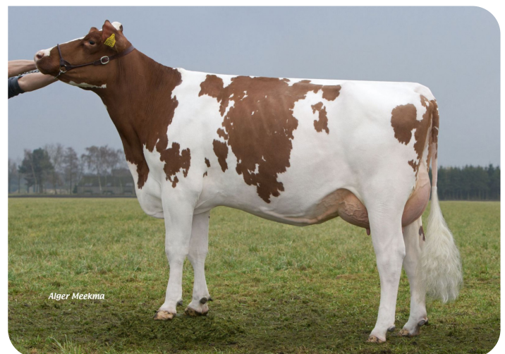
Grashoek Liza 410 (v. Cracker W rf) Eig.: Melkveebedrijf Grashoek b.v., Grashoek