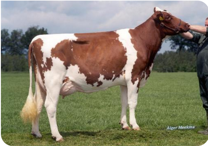
Ruth 31 (AB 88)