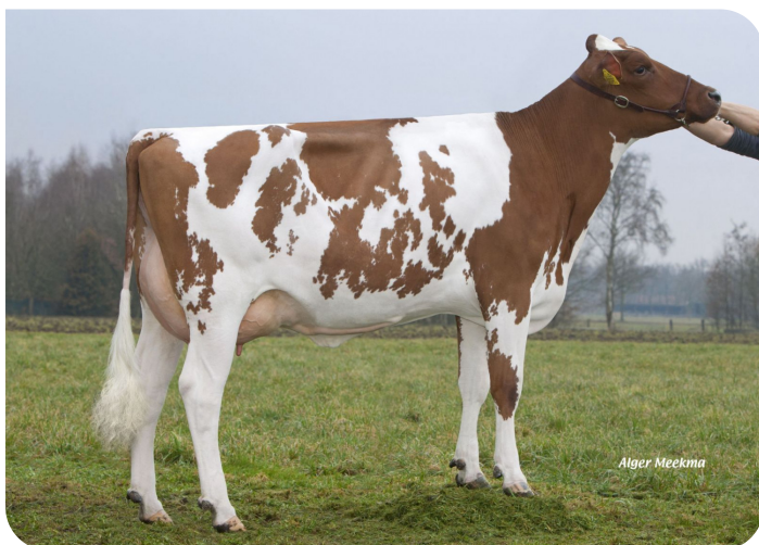
Grashoek Liza 413 (v. Cracker W rf) Eig.: Melkveebedrijf Grashoek b.v., Grashoek