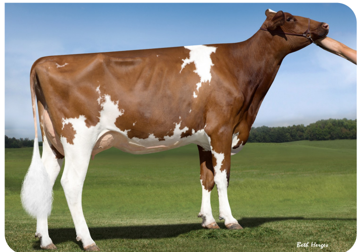
Khw Alchemy Adeline-Red (v. Hunsberger Alchemy) Betovergrootmoeder van Pele Red