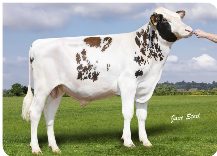
De Uitdaging SJK Pele Red