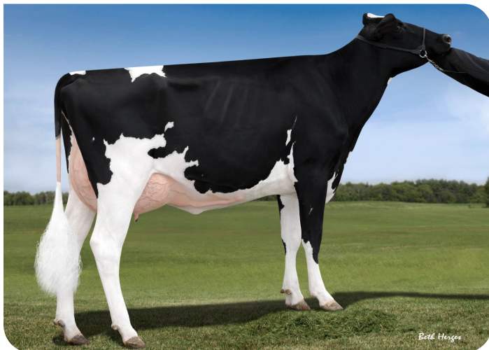
Blondin Supersire Aroma (v. Seagull-Bay Supersire) Overgrootmoeder van Pele Red