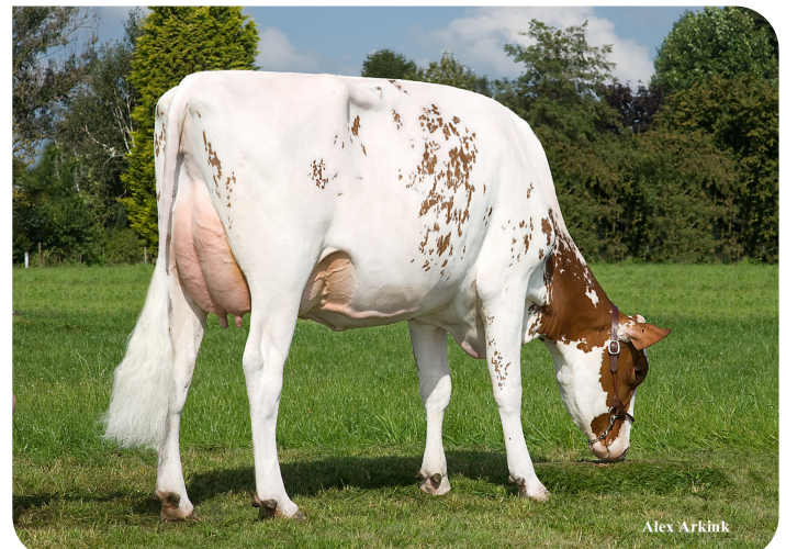
JK Eder All P Red (AB 86) (moeder van All Star rf (PP))