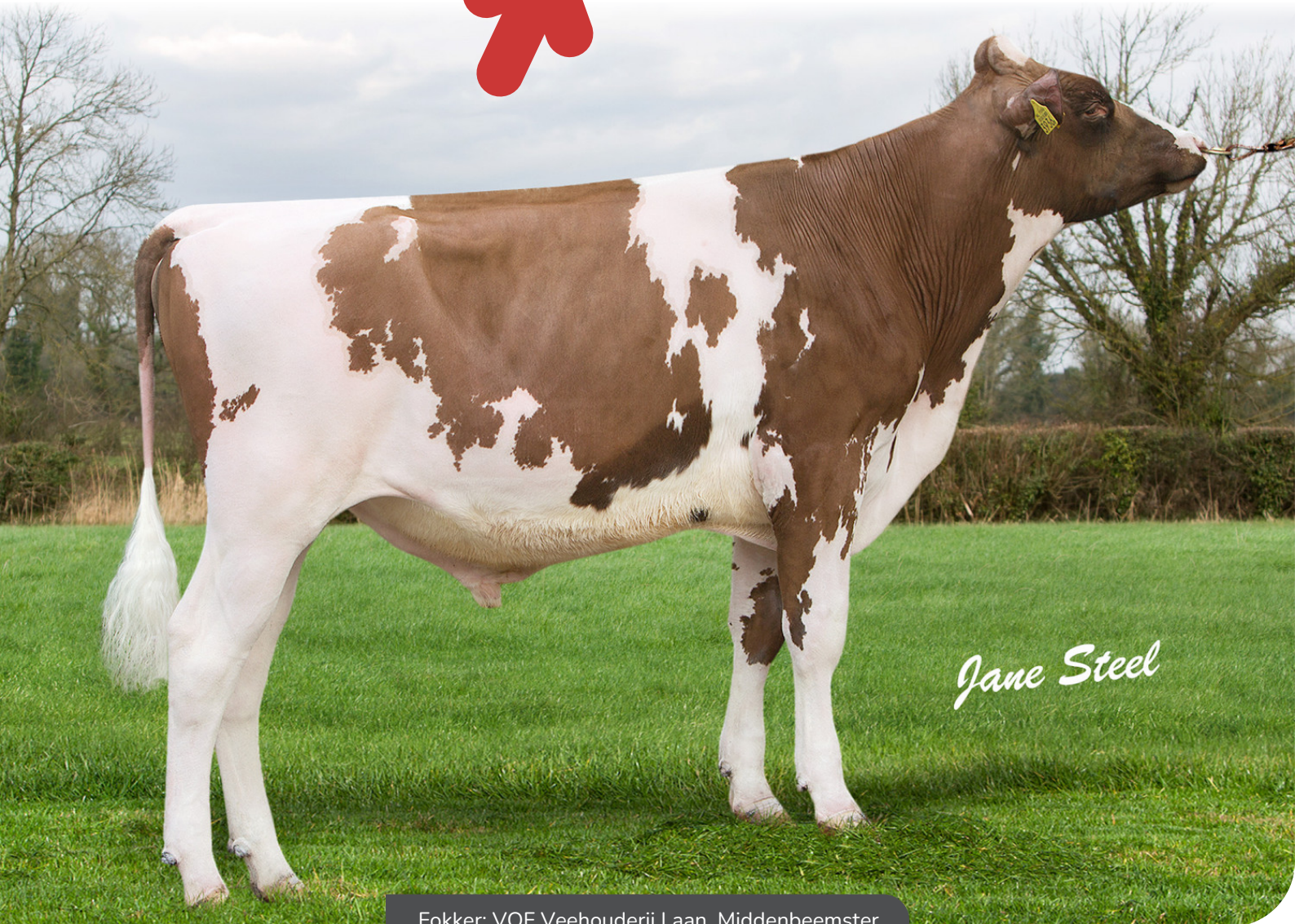
Fokker: VOF Veehouderij Laan, Middenbeemster