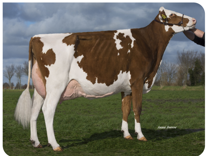
BTS Avea Red (moeder van Alphaman)