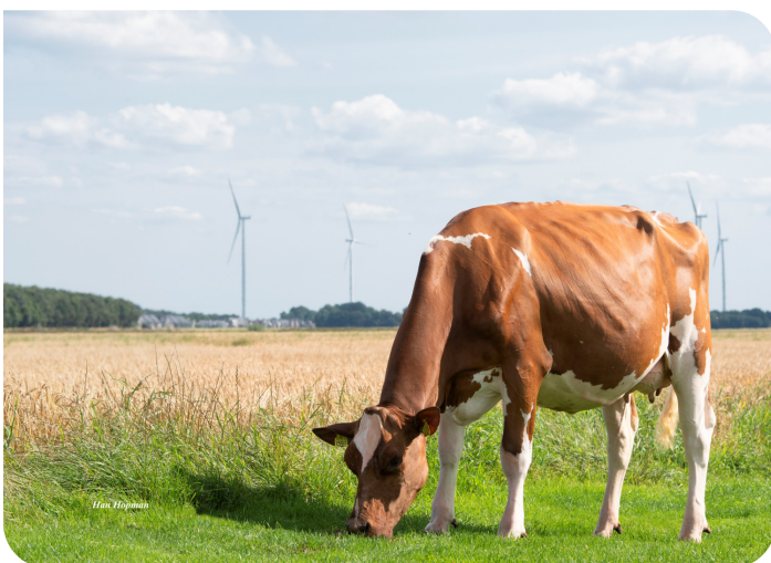
Drouner Aiko 1591 (AB 88) Moeder van Abraxas Red P