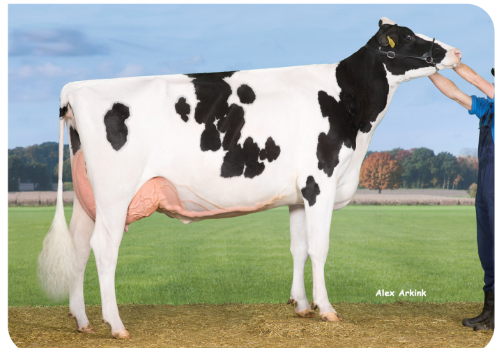
Drouner K&L Aiko 1398 (AB 89) Grootmoeder van Augustus P-Red