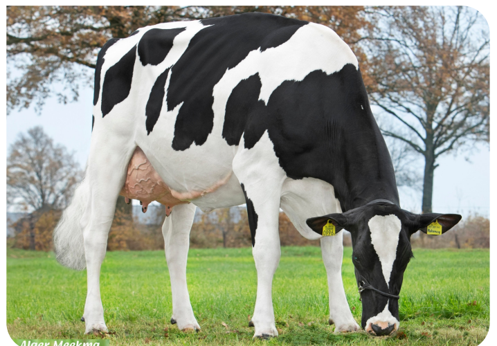
Parade 207 (v. Potency Red) Eig.: Mts. A.J.M. Lenferink, Almelo