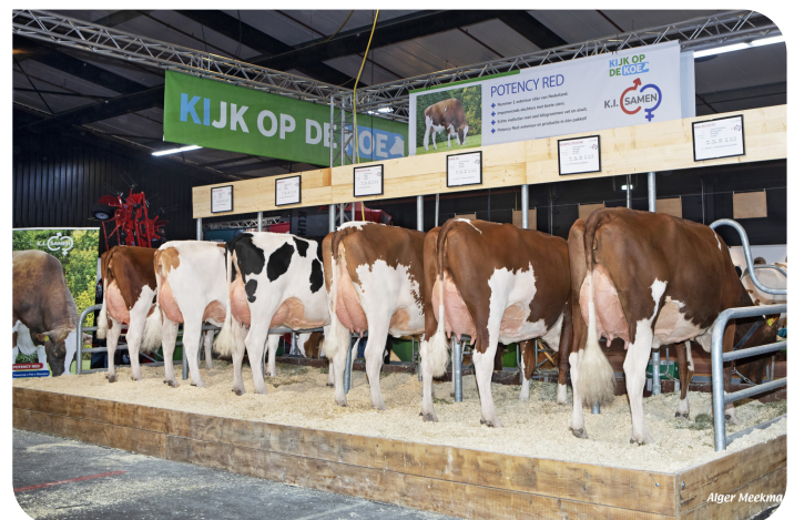
Dochtergroep Drouner Potency, RMV Hardenberg 2025