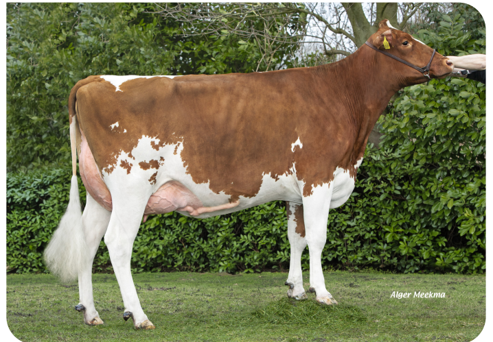
Cuperius 1252 (v. Potency Red) Eig.: VOF Gebr. Posch, Westwoud