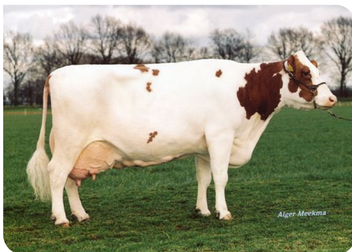
Dz Mies 118 (AB 86) (grootmoeder van Thijmen)