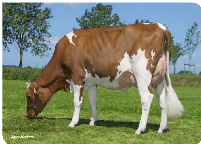
Hennie 60 (v. Fireball) Fig.: Mts. Bleijenburg, Kamperveen