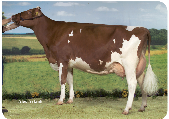
Karin 52 (A 90) (grootmoeder van Fireball)