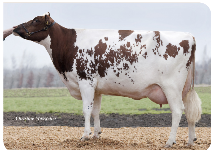
RH Meggy-J (AB 88) (moeder van Gandalf)