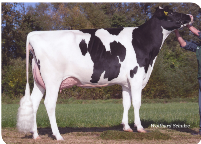
Tonki (v. Pikachu)