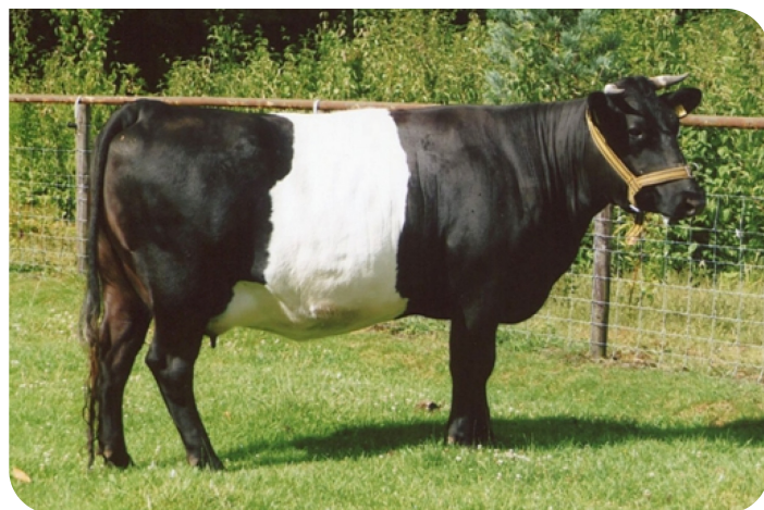
Paula 6 (v. Gozer) KS Eig.: Dhr. P.P.A.B. Weijnen, Velp (NB)