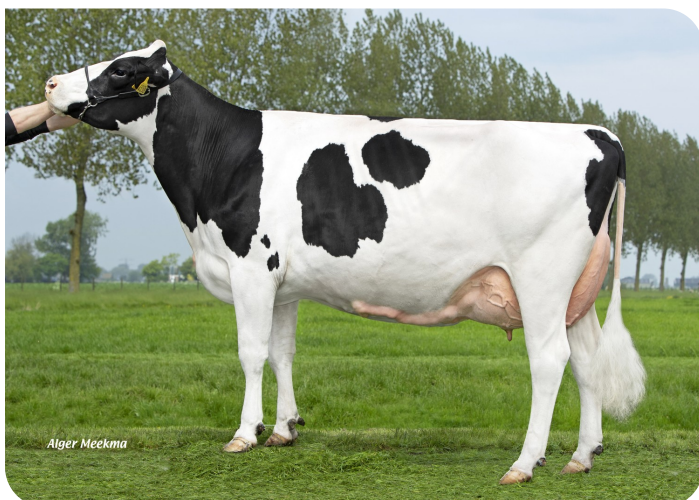
Beatrix 364 (v. Conqueror P)

Eig.: Melkveebedrijf R. Vlaar BV, 'T Veld