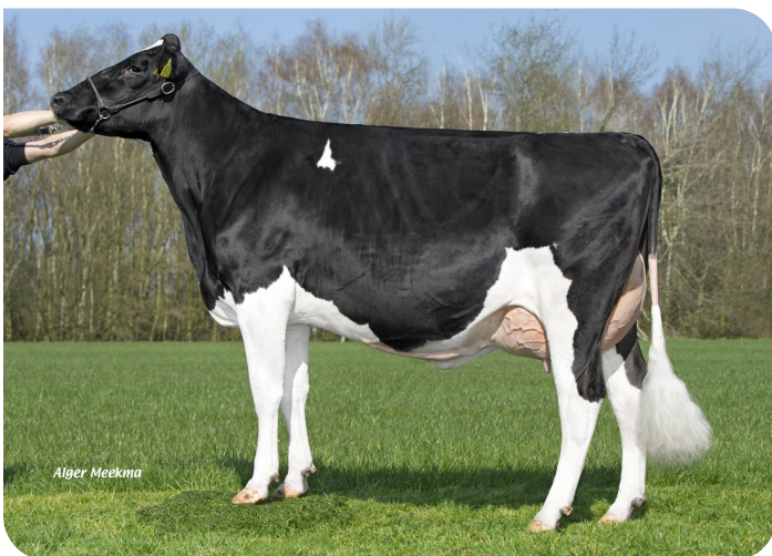
Grashoek Everette 10 (v. Conqueror P) Eig.: Melkveebedrijf Grashoek b.v., Grashoek