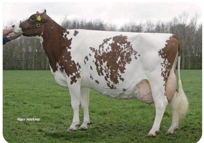
Mien 36 (AB 88) Moeder van Conqueror P