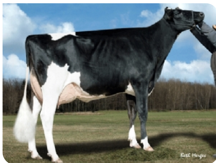
Dirt-Road Goldwyn Cami-ET (AB 86) (moeder van Innovation)

Fokker: Fok- en melkveebedrijf K.I. Samen B.V., Grashoek