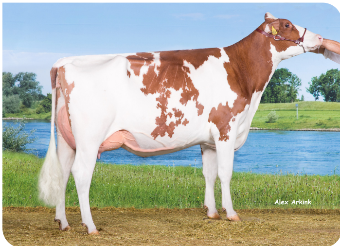
Drouner AJDH Aiko 1288 (AB 88) (halfzus van Kentucky (Pp))