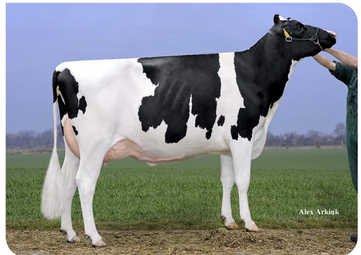
Drouner AJDH Aiko (AB 87) (moeder van Kentucky (Pp))