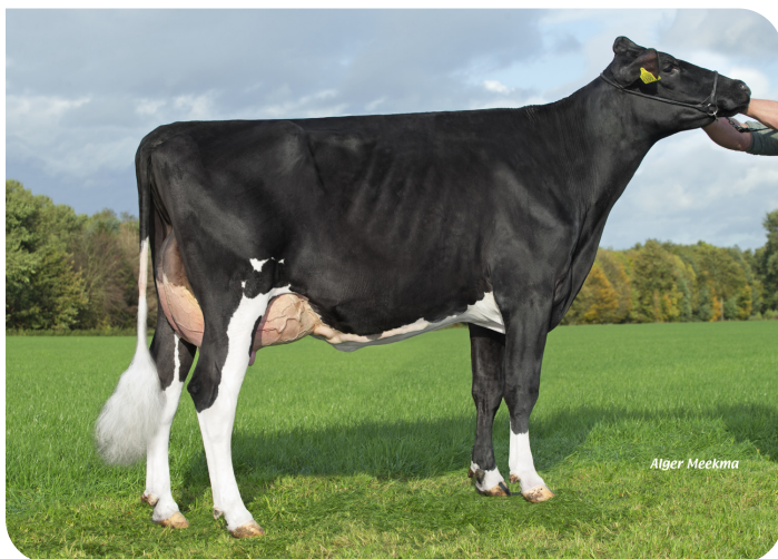
Grashoek Nel 193 (v. Kentucky (Pp)) Eig.: Melkveebedrijf Grashoek, Grashoek