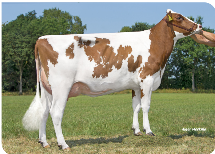
Grashoek Mina 480 (v. Time Zone (Pp)) Eig.: Melkveebedrijf Grashoek b.v., Grashoek