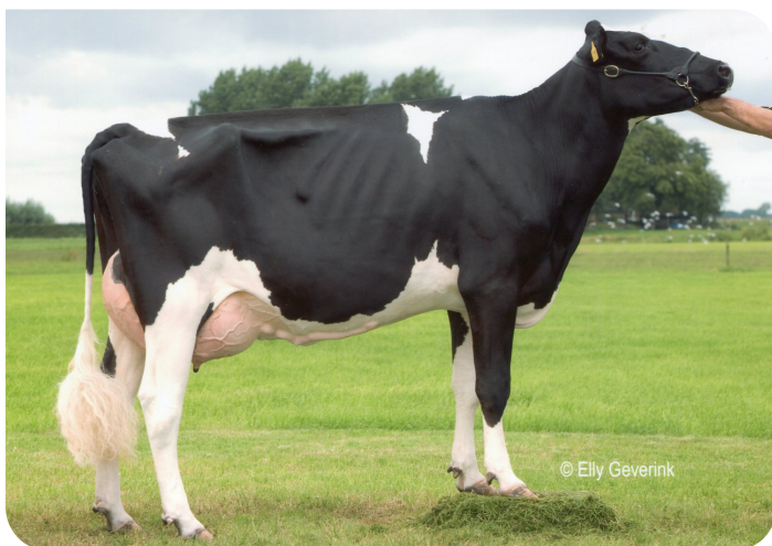
Heuvel Geertje 265 (A 90) (overgrootmoeder van Cerny)