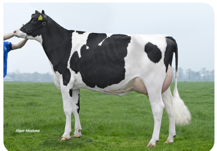
Hoekland Kekke 105 (AB 86) (v. Bono)