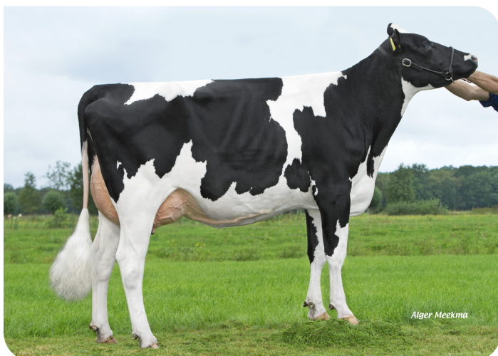
Anna 289 (v. Bono)