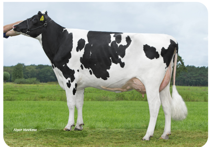
Corrie 170 (v. Bono) Eig.: Mts. J. & G. & L. Hooikammer-Tuin, IJhorst