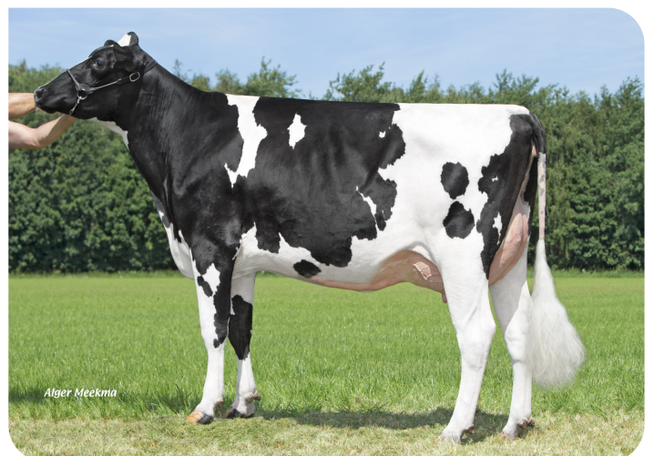
Grashoek Silke 244 (AB 88) (v. Esmar) Fig.: Melkveebedrijf Grashoek b.v., Grashoek