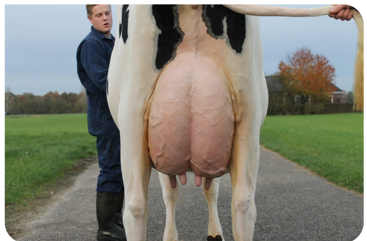
Holbra Malon 8 (Volle zus van Mastershot) Fig.: Holbra Holsteins, Laren (Gld.)