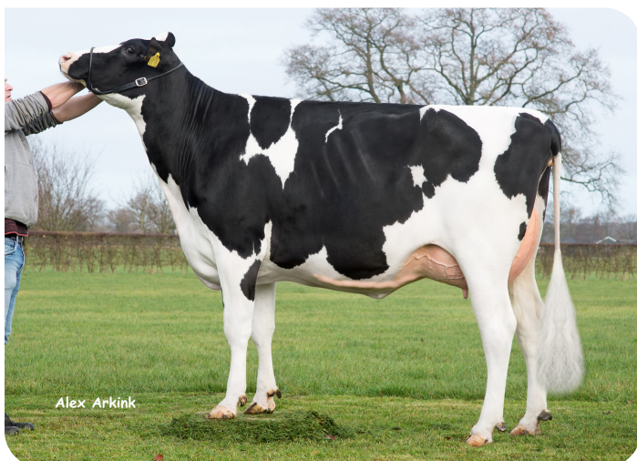
Holbra Malon 3 (AB 88) Moeder van Mastershot