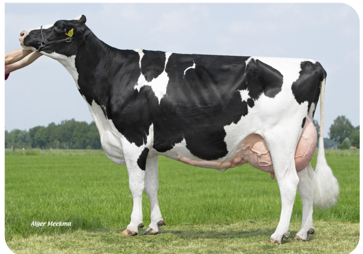
Holbra Malon 3 (AB 88) Moeder van Mastershot