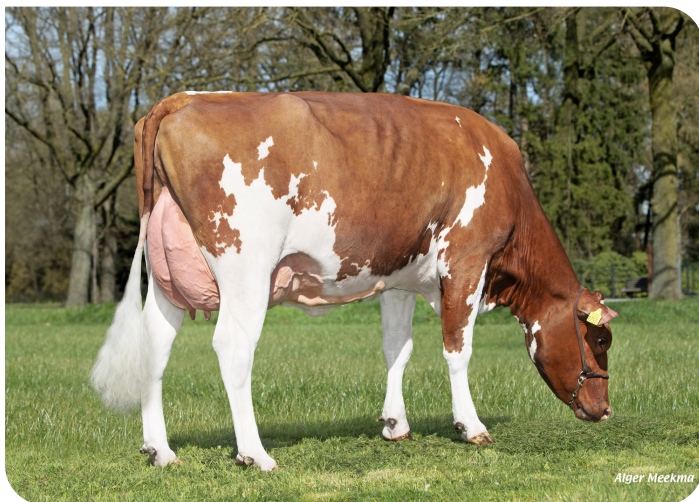
OA Janna 3055 (v. Red Ravello) Eig.: Rops Dairy, Ysselsteyn