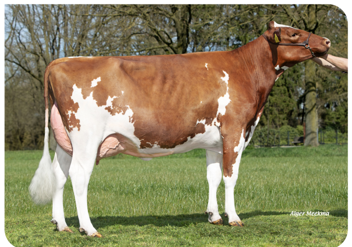
OA Janna 3055 (v. Red Ravello) Eig.: Rops Dairy, Ysselsteyn