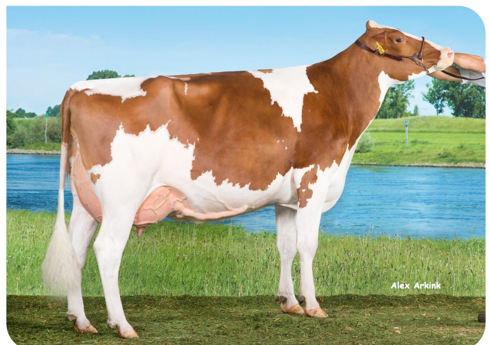
Huntje Holstein Anemoon 183 Moeder van Red Ravello