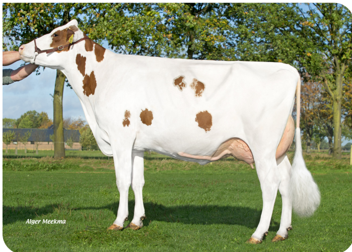
Liza 410 (v. Red River) Eig.: Agri-Services Fokmelkveebedrijf Frencken, Reuver