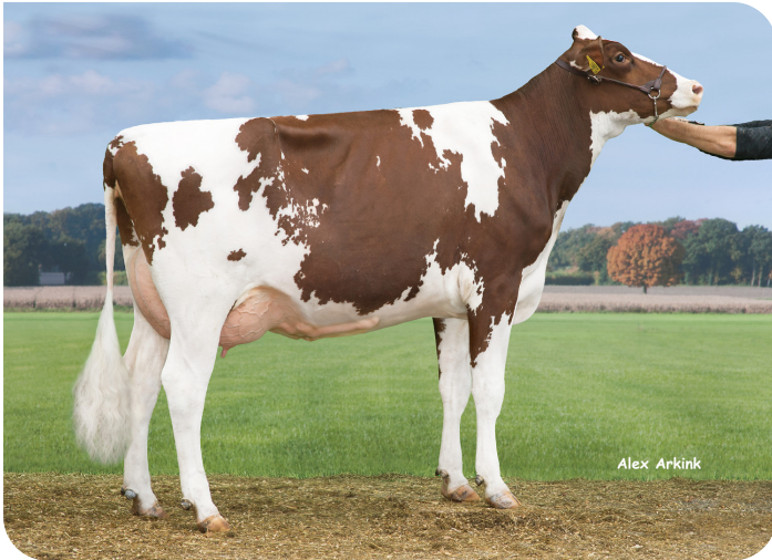
Huntje Anemoon 117 (AB 86) (moeder van Red River)