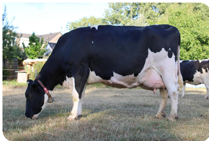
Aukje 197 (AB 86) Moeder van Jabideck Red