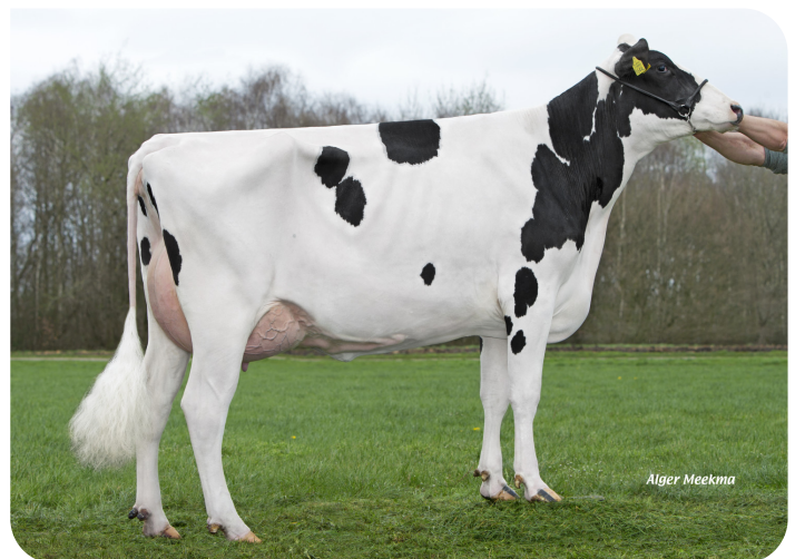
Tailwind Cinderella 4 (v. Mr. Winner) Fig.: Dhr. M. Hekers, Ospel