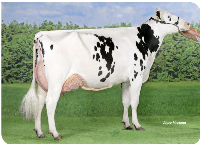
JIMM. Holstein Hellen 589 (A 94) (moeder van Mr. Winner)