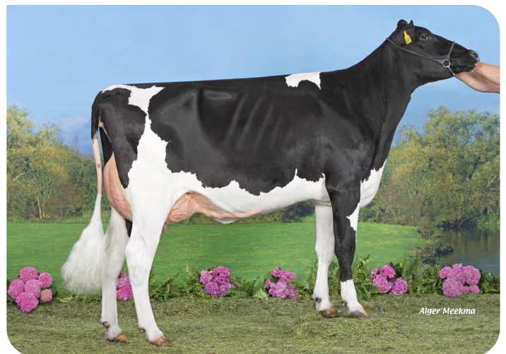
Koepon Pbal P Doma 5 (grootmoeder van Debut PP)