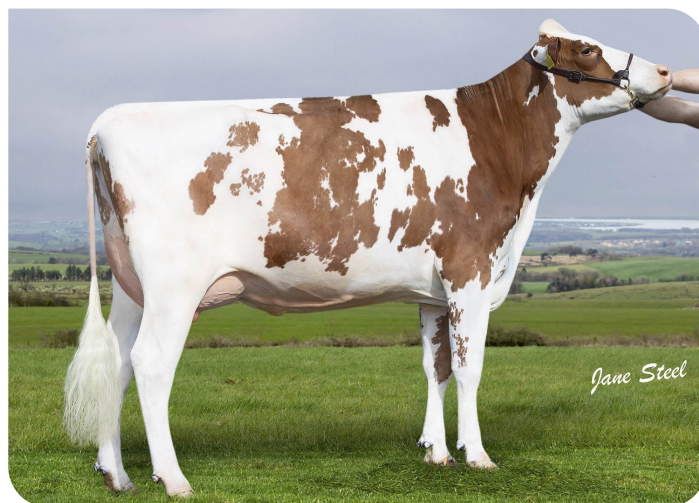
Wyredale Refind Trixie-Red (AB86)(v. Robin Red)