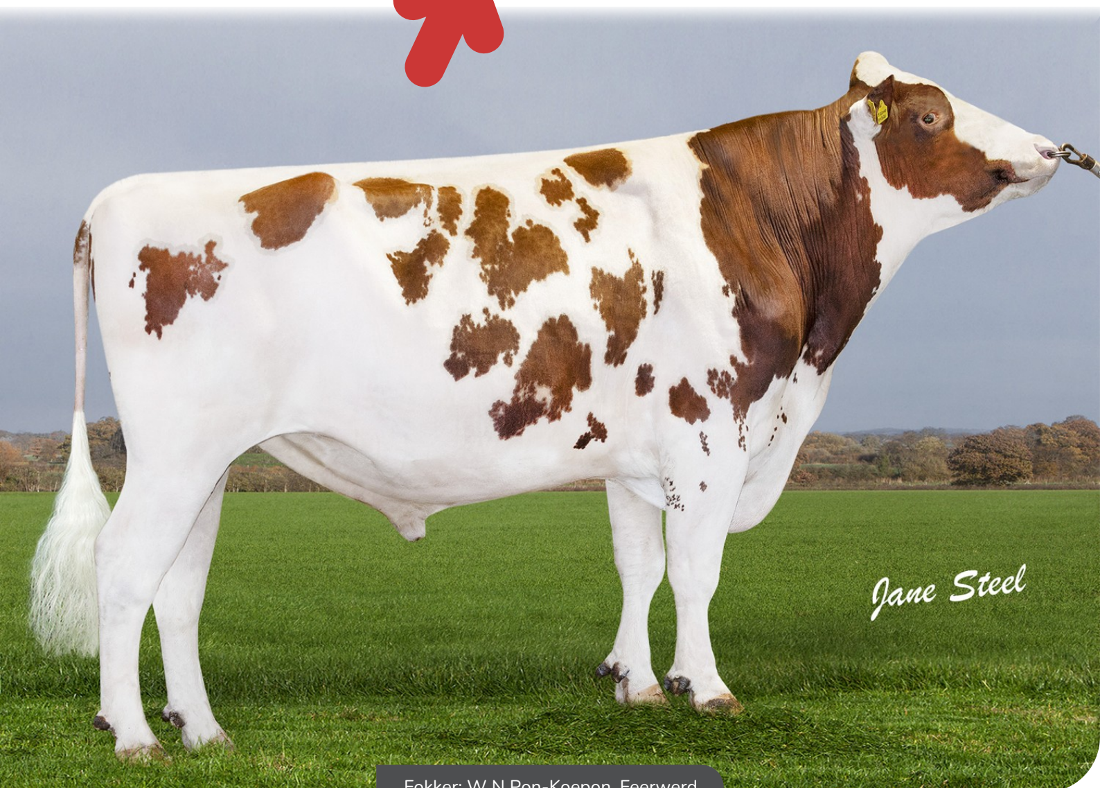
Fokker: W N Pon-Koepon, Feerwerd