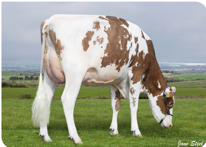
Wyredale Refind Trixie-Red (AB86)(v. Robin Red)