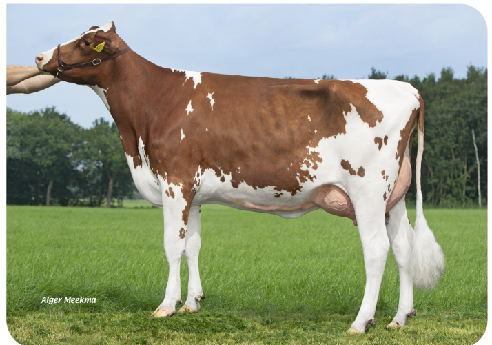
Grashoek Nel 203 (AB 85) (v. Tucson) Eig.: Melkveebedrijf Grashoek b.v., Grashoek