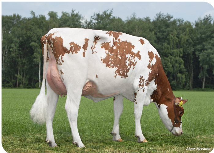
Grashoek Silke 269 (v. Tucson) Eig.: Melkveebedrijf Grashoek b.v., Grashoek