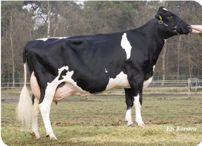
Dora 73 (AB 89) (halfzus van de moeder van Lady Lover)