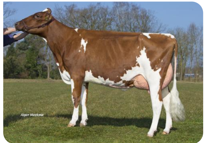
Grashoek Mitzi 9 (v. Lady Lover) Eig.: Fok- en melkveebedrijf K.I. SAMEN, Grashoek