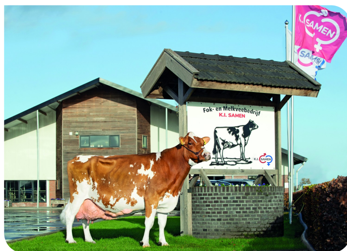
Grashoek Tonnie 72 (AB 87) (8e lact.) (v. Lady Lover) Fig.: Fok- en melkveebedrijf K.I. SAMEN, Grashoek