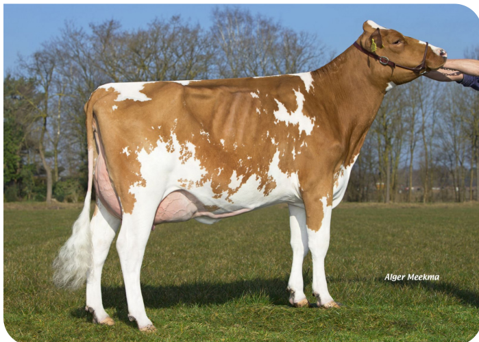
Grashoek Tonnie 72 (v. Lady Lover) Eig.: Fok- en melkveebedrijf K.I. SAMEN, Grashoek