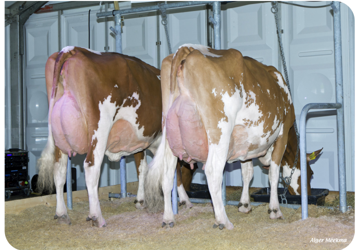
Dochtergroep Lady Lover Belevingsdagen 2016