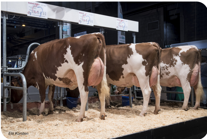
Dochtergroep Lady Lover Gorinchem 2016