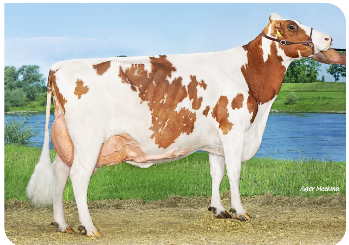
Grashoek Janna 155 (v. Macgyver van de Peul) (4e kalfs) Eig.: Fok- en melkveebedrijf K.I. Samen B.V., Grashoek