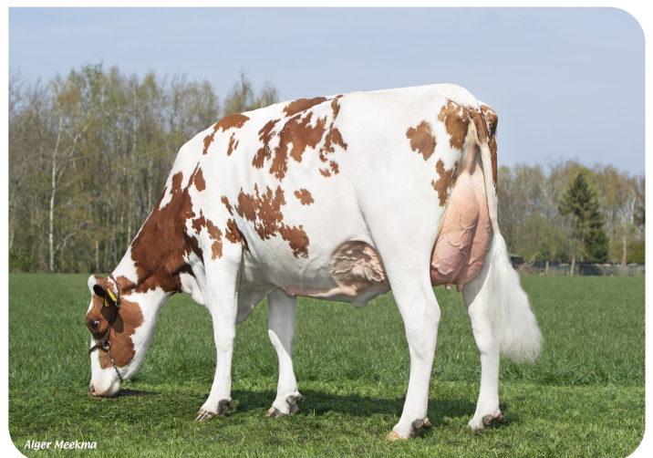
Grashoek Janna 155 (v. Macgyver) Eig.: Fok- en melkveebedrijf K.I. Samen B.V., Grashoek