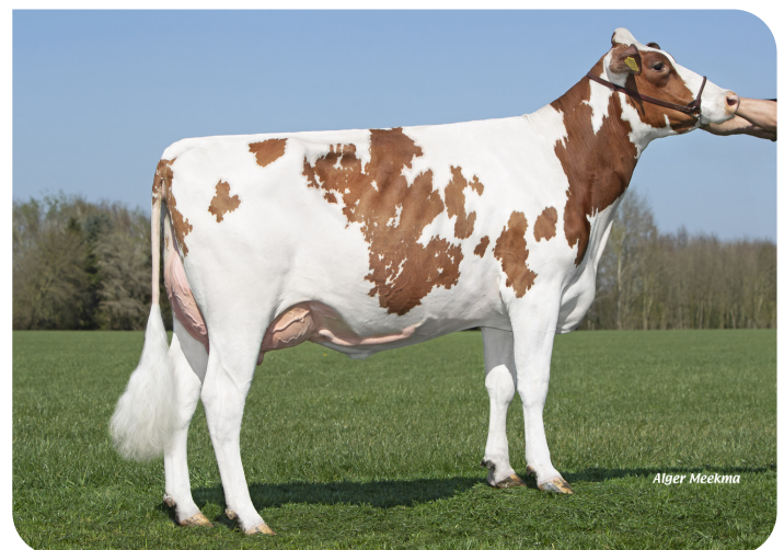
Grashoek Janna 155 (1e lact.) (v. Macgyver) Fig.: Fok- en melkveebedrijf K.I. Samen B.V., Grashoek