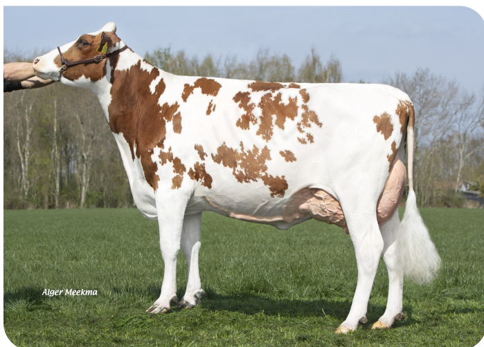
Grashoek Janna 155 (2e lact.) (v. Macgyver) Fig.: Fok- en melkveebedrijf K.I. Samen B.V., Grashoek