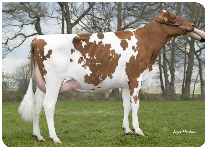
Hanny 71 (v. Macgyver) Eig.: Mts. Overeem, Lunteren