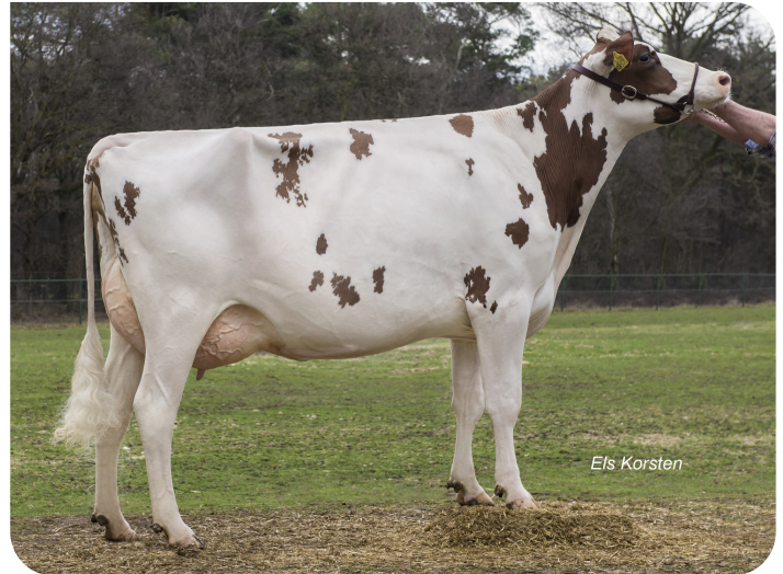
Massia 9857 van de Peul (EX 91) (moeder van Macgyver)