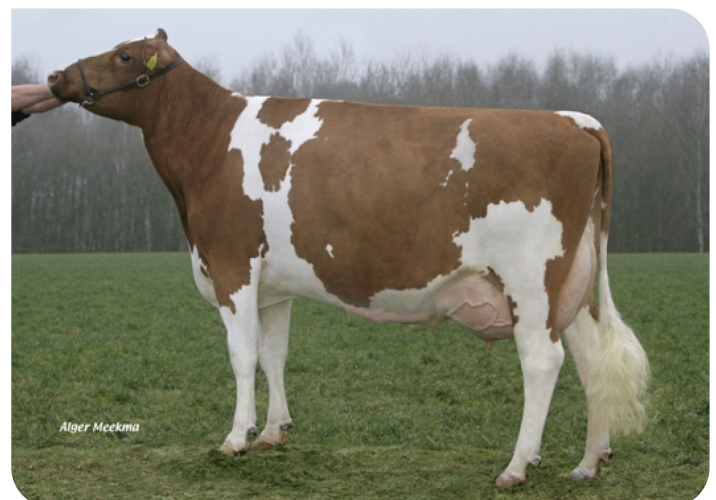
Grashoek Dame 52 (v. Lustrum) (foto als 3de kalfs) Eig.: Melkveebedrijf Engelen v.o.f., Grashoek