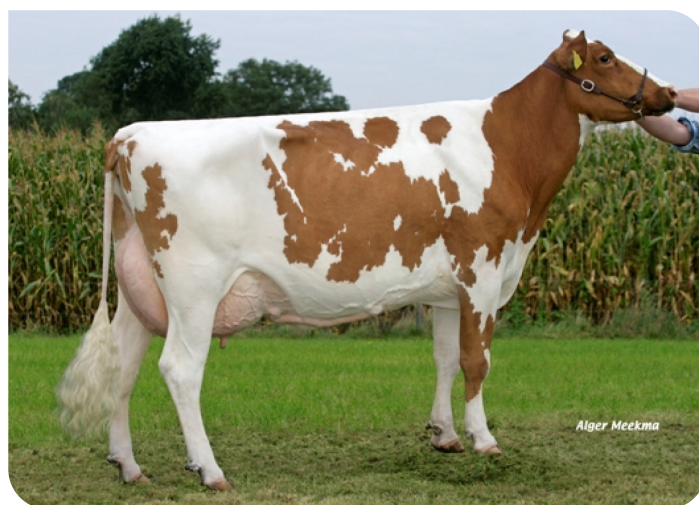
Maga 59 (v. Lustrum) Eig.: V.O.F. Gebleektendijk, Nederweert-Eind