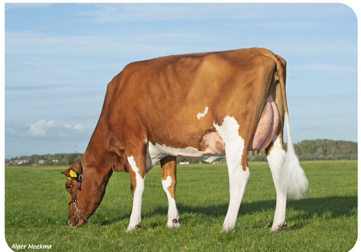
Wekken-Holstein Pluimpje 64 (v. Tribute Red) Fig.: C.J. van der Wekken, Maasdam