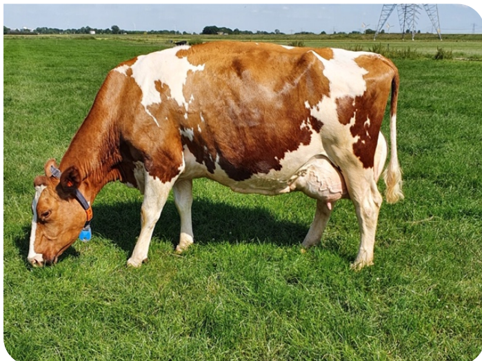
Mariahoeve Trees 142 (moeder van Tribute Red)